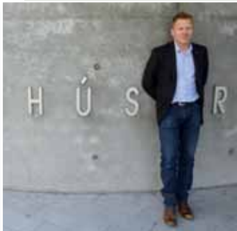
Jon Gnarr, Bürgermeister von Reykjavik.

Der neue Bürgermeister von Islands Hauptstadt Reykjavik, Jon Gnarr, hat mit einem launigen Auf-