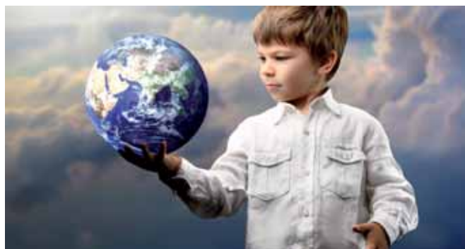
Unsere Zukunft beginnt heute mit nachhaltigen Lösungen.

Die Gemeinde Munderfing zeigt ihr Programm für die