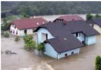
Baumschulsiedlung in Walding beim Hochwasser 2002

nationales Recht umgesetzt. Eine Tagung am 18. Oktober in Linz vermittelt die fachlichen und rechtlichen Inhalte dieser Novelle. Neu ist etwa die Berücksichtigung seltener Hochwässer und deren Schadensauswirkungen. Vertreter des Bundesministeriums für Land- und Forstwirtschaft, Umwelt und Wasserwirtschaft berichten über die Details. Anmeldung bis 4. Oktober bei Oö. Akademie für Umwelt und Natur E-Mail: uak.post@ooe.gv.at www.umweltakademie.at