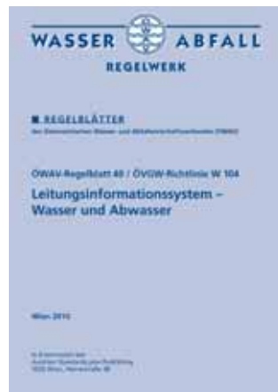
Das ÖWAV-Regelblatt 40.

Bei Kanalisation, Kläranlagen und Trinkwasserversorgung wurden in Österreich sehr hohe Anschlussgrade erreicht. Ab nun geht es vorrangig darum, diese Anlagen und ihren Wert zu er-